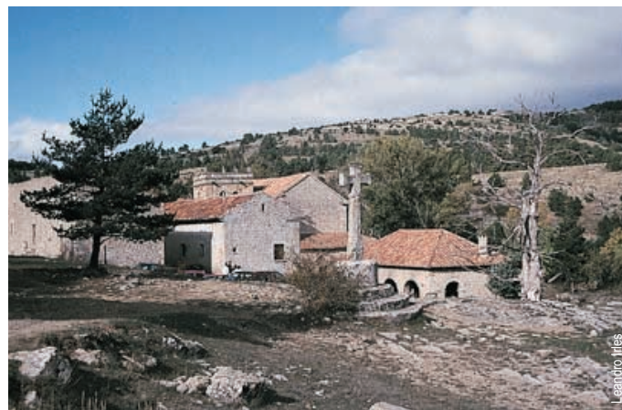
Sant Joan de Penyagolosa