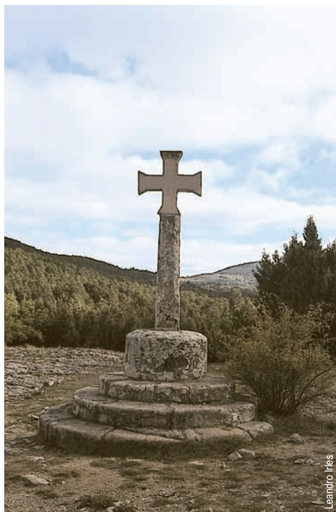
Peiró de Sant Joan de Penyagolosa

entidad promotora: Centro Excursionista de Castellón