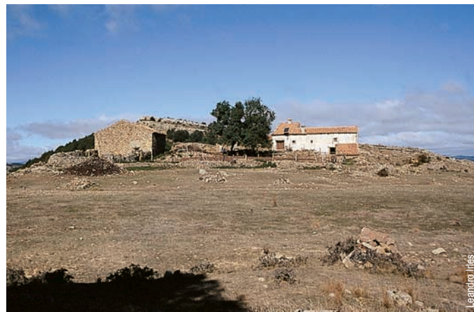
Mas de Cambreta