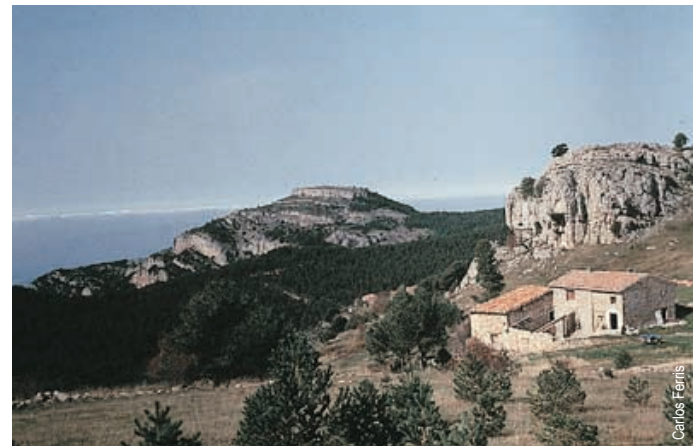
Tossal de Marinet