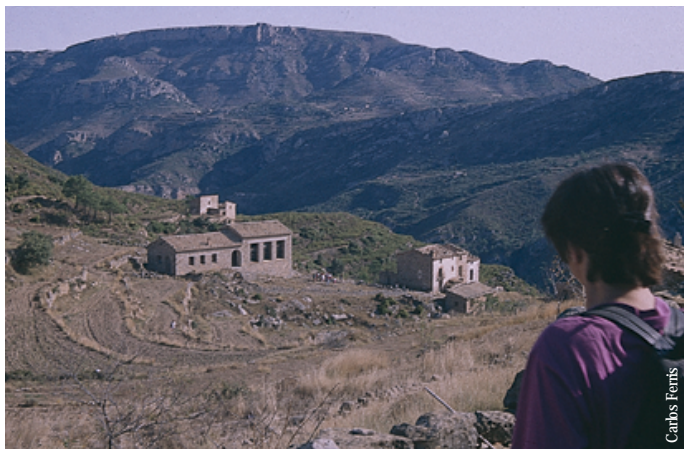
Mas de la Costa